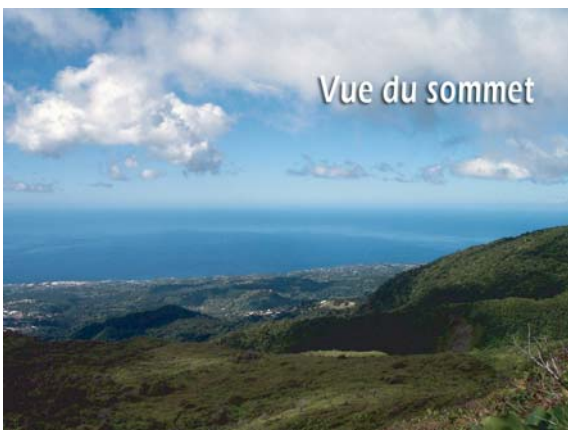
Vue du sommet