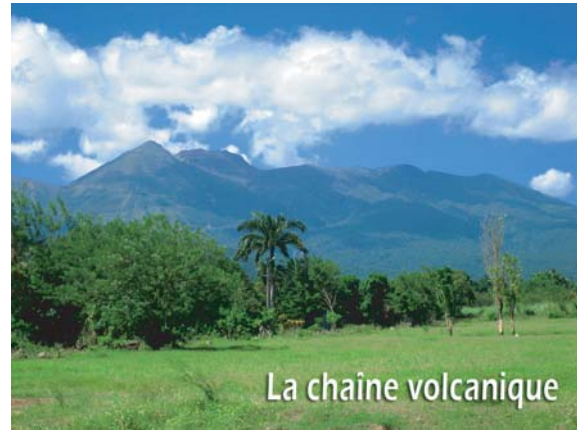
La chaîne volcanique

1 467 mètres Le sommet du volcan de la Soufrière est le point culminant des Petites-Antilles ! 1h de marche